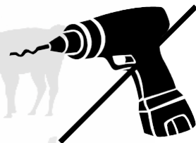
Niet aan apparaten komen