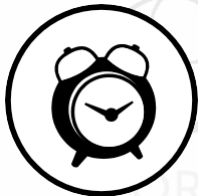
Op tijd komen