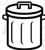
Eigen rommel opruimen